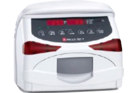
BOMBAS DE INFUSION