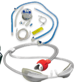
INSUMOS & REPUESTOS